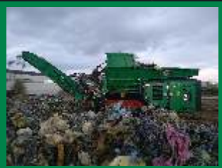
Colchones: 200 unids/h