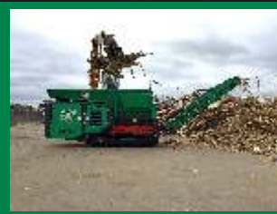
Madera: 65 tn/h