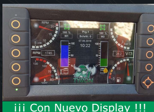
iii Con Nuevo Display !!!

Nos reservamos el derecho de venta en el ínterin