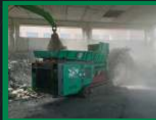
R.S.I: 45 tn/h