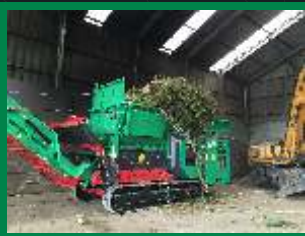
Verde: 60 tn/h